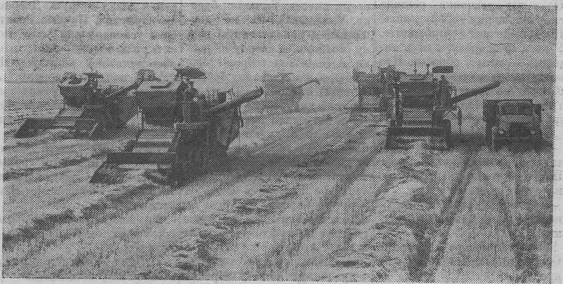
На широких просторах полей колхозов и совхозов работают самые современные машины.