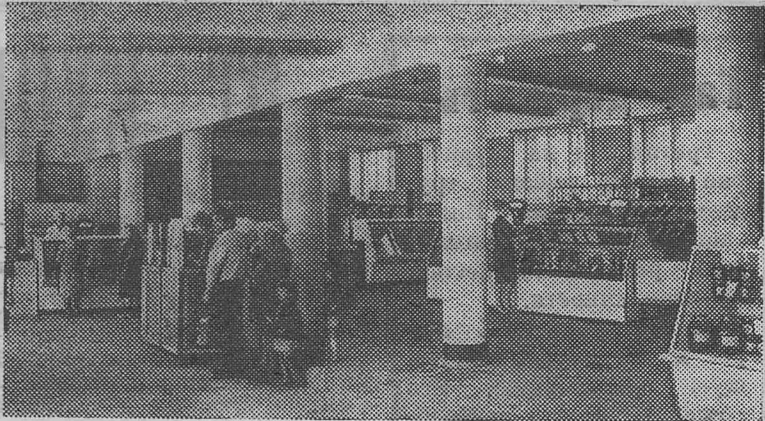
Ленинградская область. В городе Тихвине вступают в строй новые культурно-бытовые учреждения, предприятия торговли и общественного питания.

Население Советского Союза составило на 1 июля 1967 года 235,5 миллиона человек.