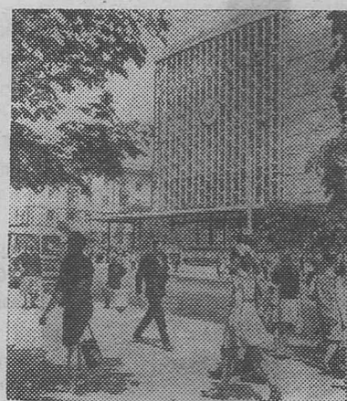
Кишинев. На проспекте Ленина.

Двадцать тысяч нарядных шелковых платяев можно сшить из ткани, которую обязался изготовить из экономленного сырья Бендерский шелковый комбинат.