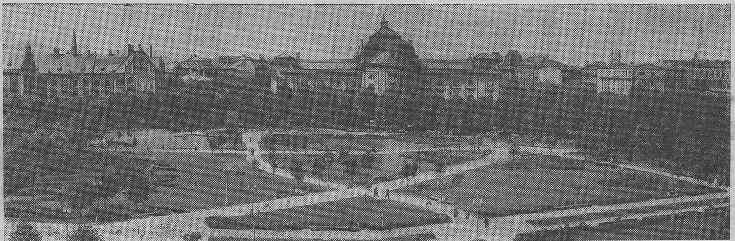
РИГА. Сквер на площади Коммунаров.