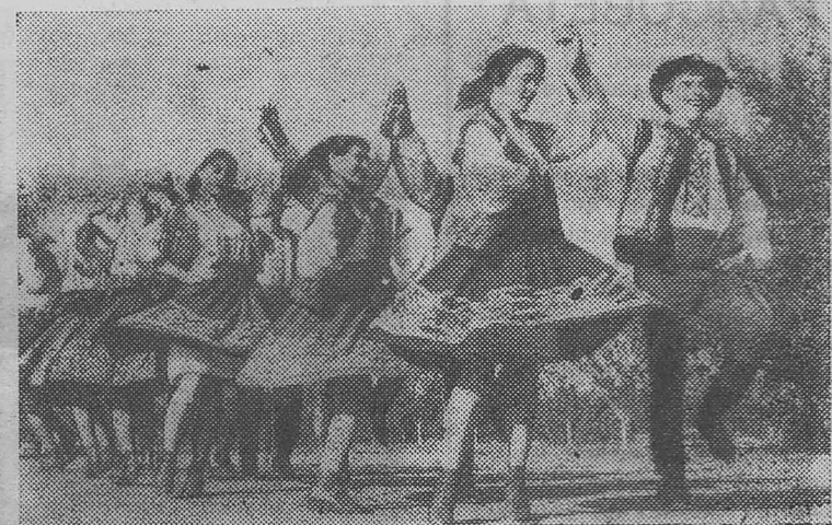
На снимке внизу: участники художественной самодеятельности Дома культуры села Незавертайловка испол-