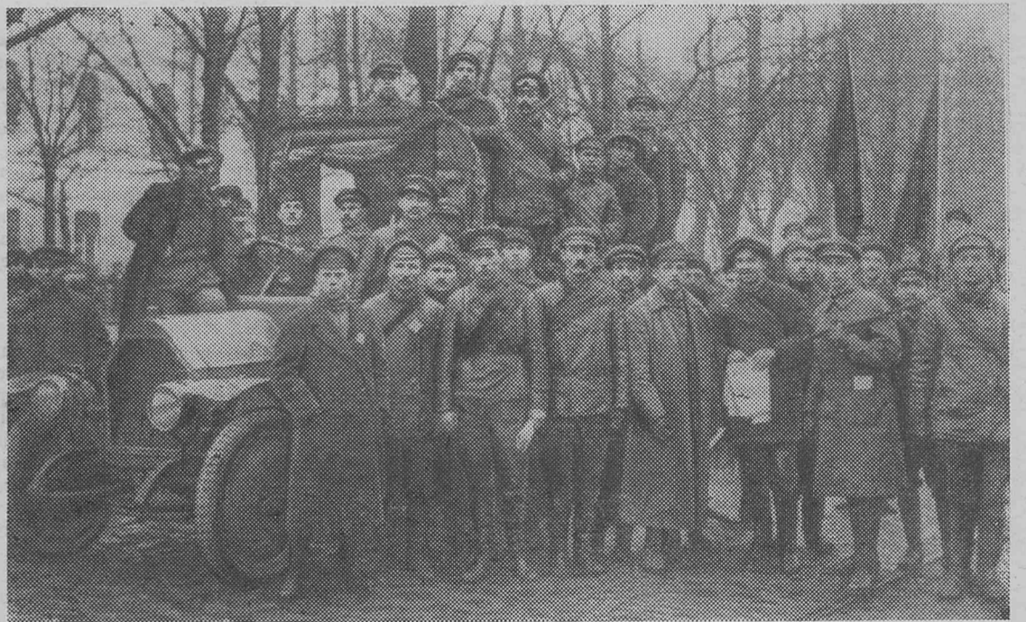
Петроград, Октябрь 1917 года. Красногвардейцы.