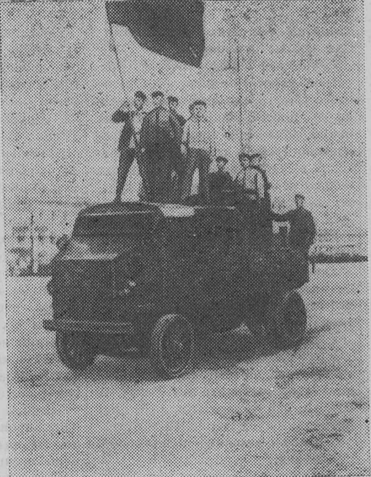
Красногвардейцы на Красной площади в Москве. 1917 год.