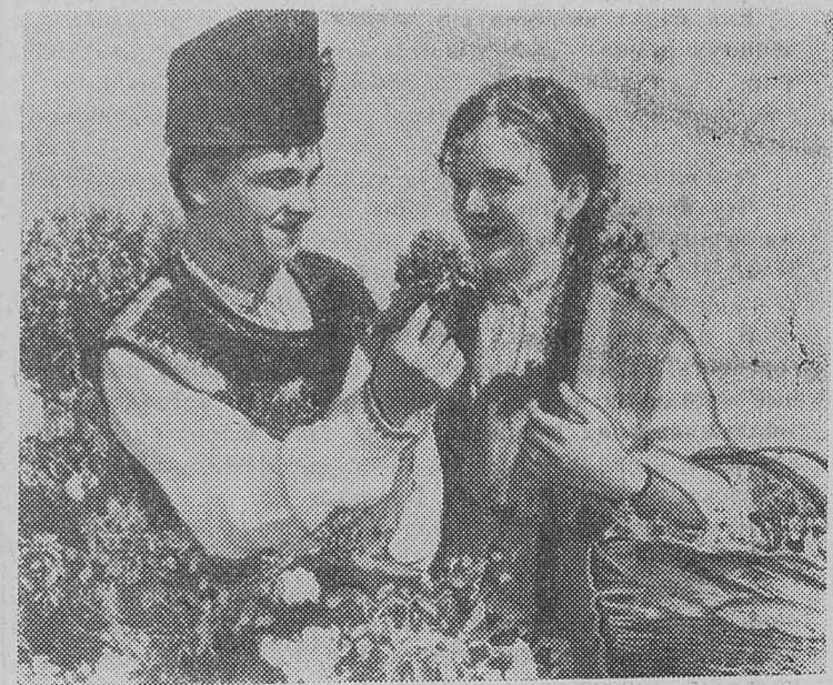
БОЛГАРИЯ. В знаменитой Казанлыкской долине в разгаре сбор розовых лепестков. Ежедневно на местные розоварни поступают десятки тонн этого ценного сырья, из которого производится чудесное болгарское розовое масло. Оно пользуется спросом во многих странах мира, в том числе и в Советском Союзе.

Жизненная сила идей ленинского «Письма к американским рабочим» блестяще подтверждена всем ходом событий. Международное коммунистическое движение — самая влиятельная сила современности. Силы социализма, демократии и прогресса все организованнее и активнее ведут борьбу против угрозы войны, за мир. Верный заветам Ленина, советский народ идет в едином интернациональном строю с народами братских стран социализма; международным рабочим классом, силами национально-освободительного движения, оказывая им всемерную помощь и в свою очередь высоко ценя поддержку своих зарубежных братьев.