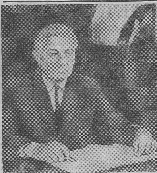
Президент Чехословацкой Социалистической Республики товарищ Людвик Свобода.