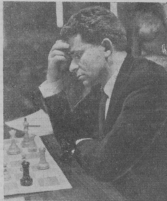
5 сентября в Киеве начнется финальный матч претендентов на первенство мира по шахматам между гроссмейстерами Борисом Спасским и Виктором Корчным. Победитель этого матча весной будущего года поспорит за шахматную корону мира с Тиграном Петросяном. На снимках: Виктор Корчный и Борис Спасский.