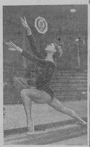
Член олимпийской сборной СССР по спортивной гимнастике Людмила Турищева.