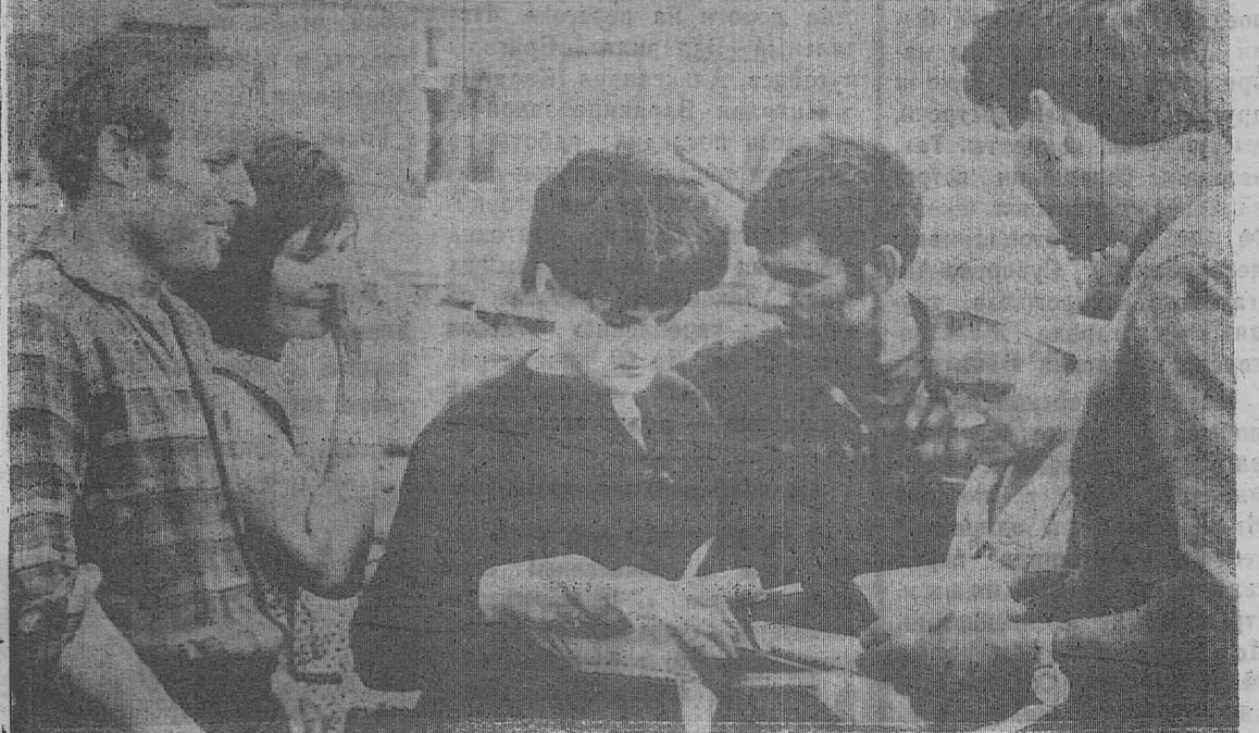
Этот снимок сделан еще тогда, когда не было регулярного автомобильного сообщения со ст. Тушамы на трассе Хребтовая—Усть-Илимская. Почта доставлялась с трудом, и каждый раз ее

приход было большим событием в жизни строителей.