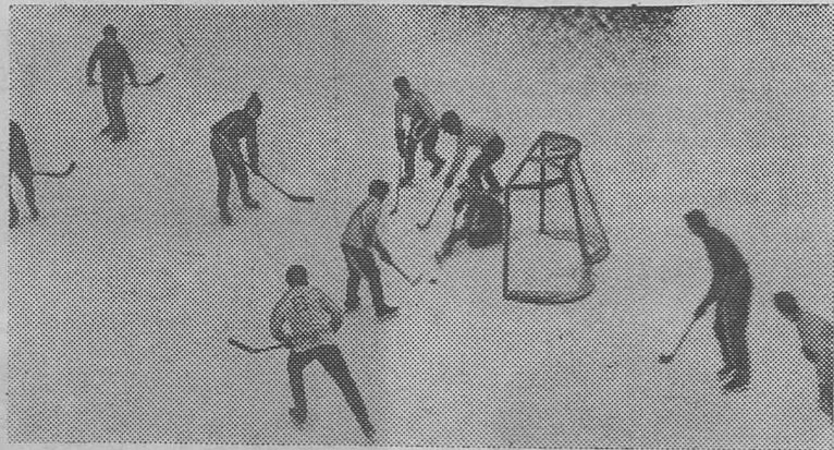
АЛТАЙСКИЙ КРАЙ. Бийский район. Семь переходящих кубков по различным видам спорта завоевали в прошлом году спортсмены зерносовхоза «Лесной». Это неплохое добавление к тем шести кубкам, которые за победы в соревнованиях оставлены им навсегда.

Телефоны: редактора — 6-92; зам. редактора и отв. секретаря — 4-98; общего отдела — 2-92; бухгалтерии — 7-97.