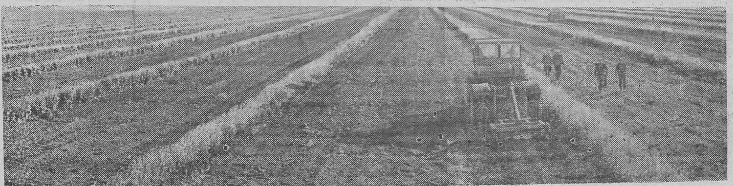
Специалисты сельского хозяйства Кустанайской области ищут пути получения высоких, устойчивых урожаев. Одной из главных забот хлеборобов является накопление и сохранение на полях влаги. Обнадеживающие результаты дают пары с посеянными на них через определенное расстояние

рядками горчицы так называемые кулисные пары.