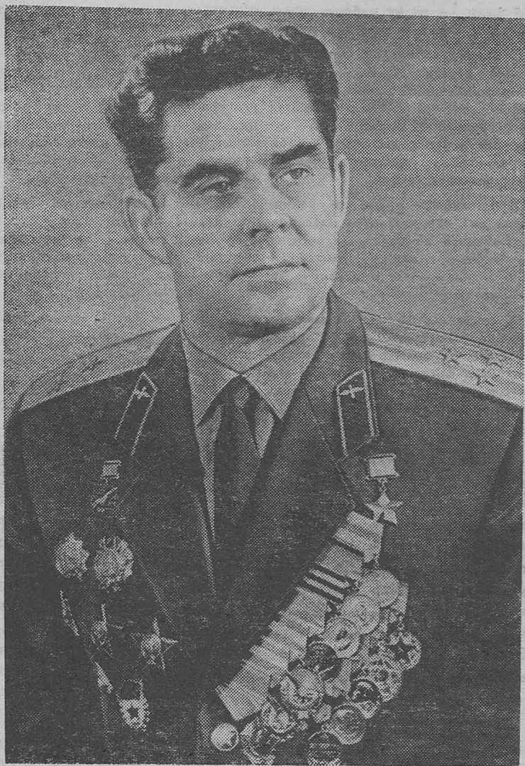
На снимке: Г. Т. Береговой.

Четыре дня продолжался беспримечательный полет корабля «Союз-3», пилотируемого за- мечательным сыном нашего народа Героем Советского Со- юза, заслуженным летчиком- испытателем СССР Георгием Тимофеевичем Береговым.