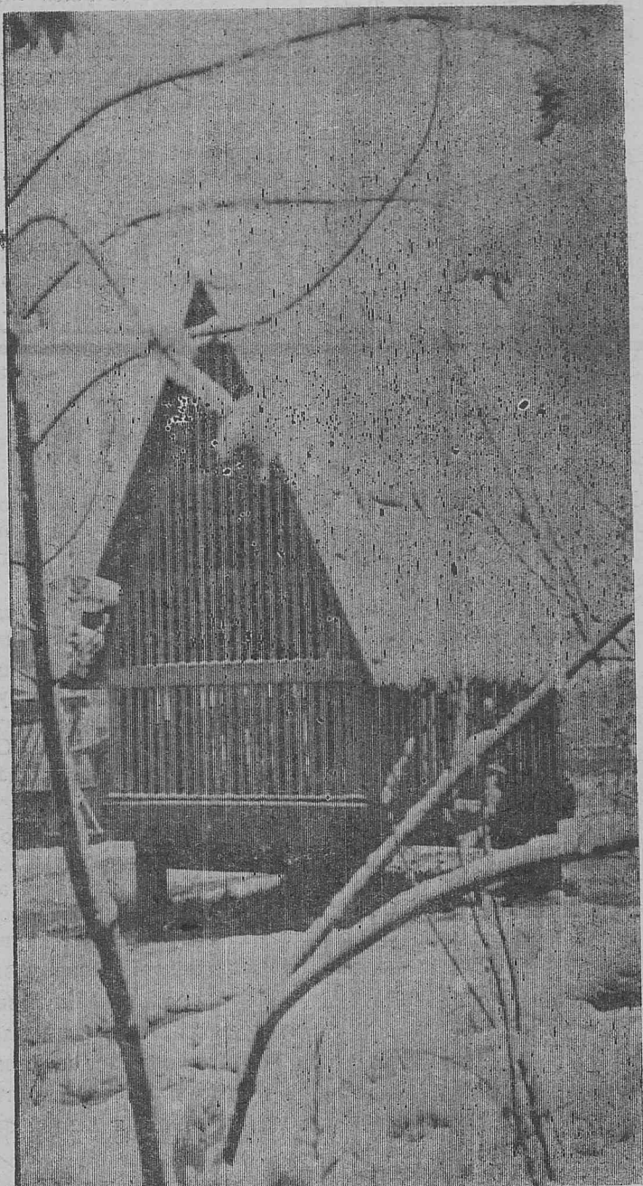
Избушка, избушка, встань ко мне передом...

Телефоны: редактора—6-92; зам. редак- общего отдела—2-92; бух- тора и отв. секретаря—4-98; галтерии — 7-97.