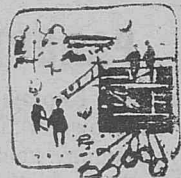
Фото и текст В. Перфильева.