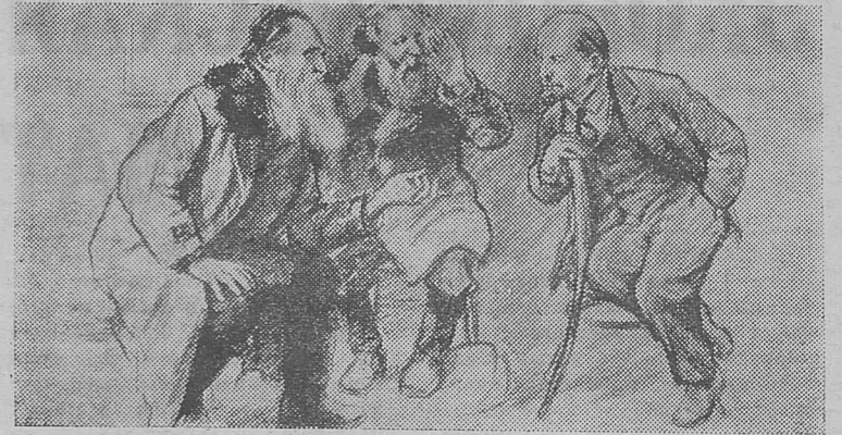
Рисунок художника Н. Жукова «Разговор по душам».