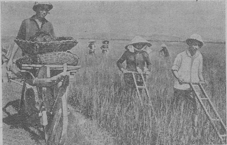
На полях Демократической Республики Вьетнам созрел зимний урожай риса. Земледельцы кооператива Ен Тхуонг (провинция Нгеан) обязались собрать по 5,5 тонны риса с гектара. НА СНИМКЕ: на полях сельскохозяйственного кооператива Ен Тхуонг.