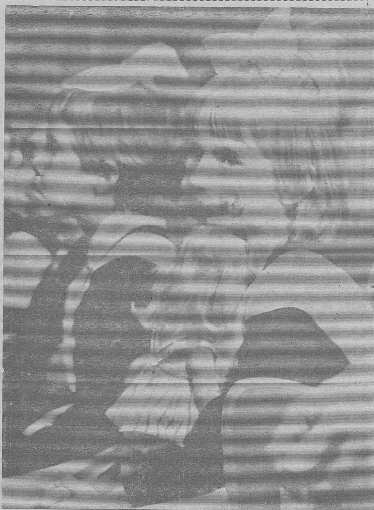
«Сибирячка» живет, действует. Практикуются здесь и встречи с учащимися. На прошедшем недавно вечере «первоклашки» поставили для своих мам концерт.