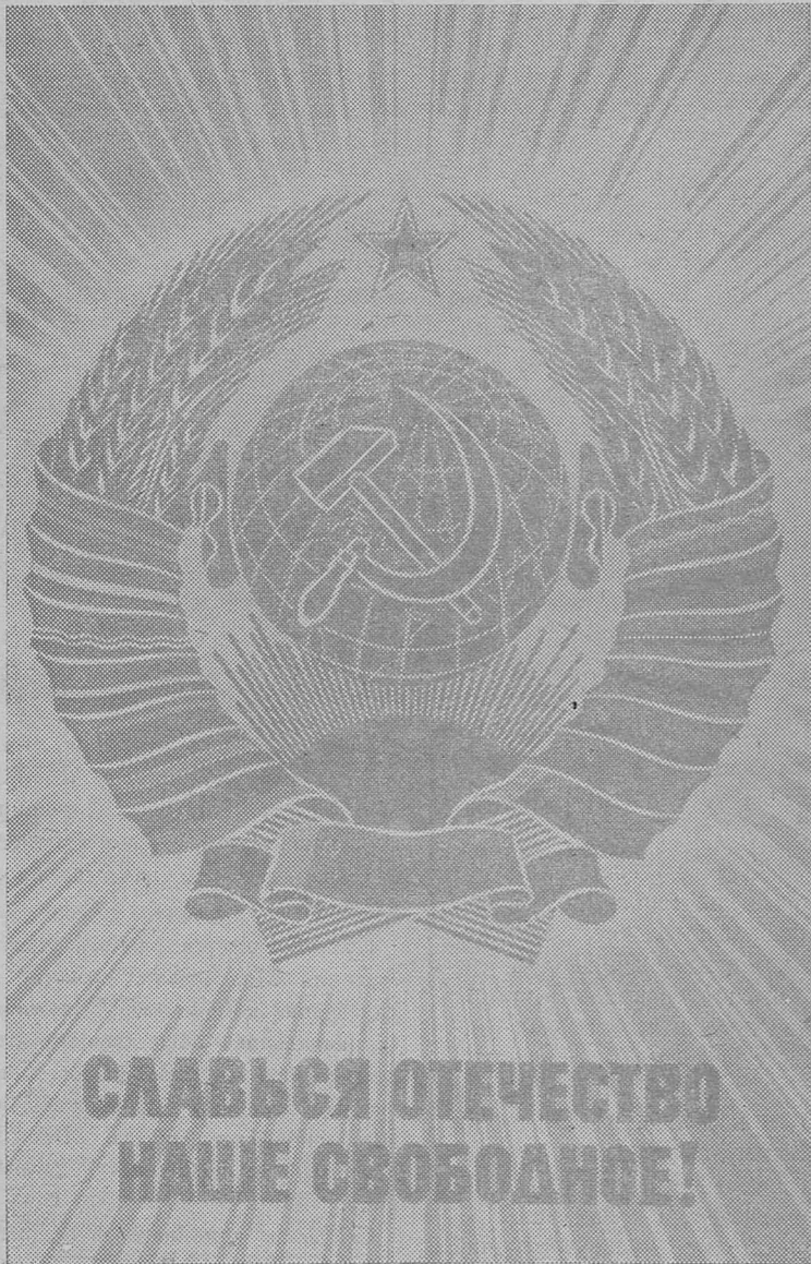
Плакат художника В. Викторова.