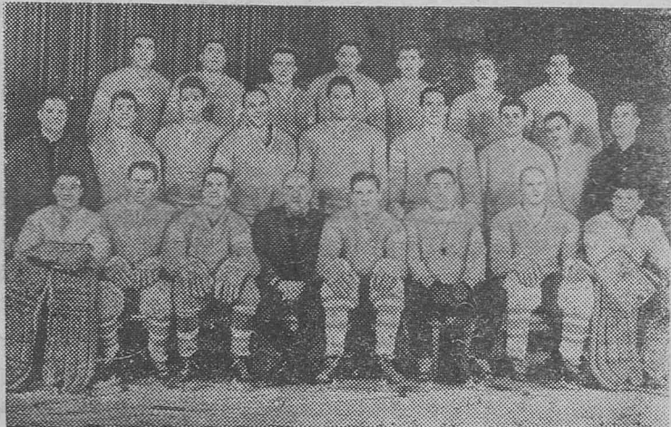
Сборная команда СССР по хоккею с шайбой. Она примет участие в X зимних Олимпийских играх в Гренобле (Франция), которые пройдут с 6 по 18 февраля 1968 года.