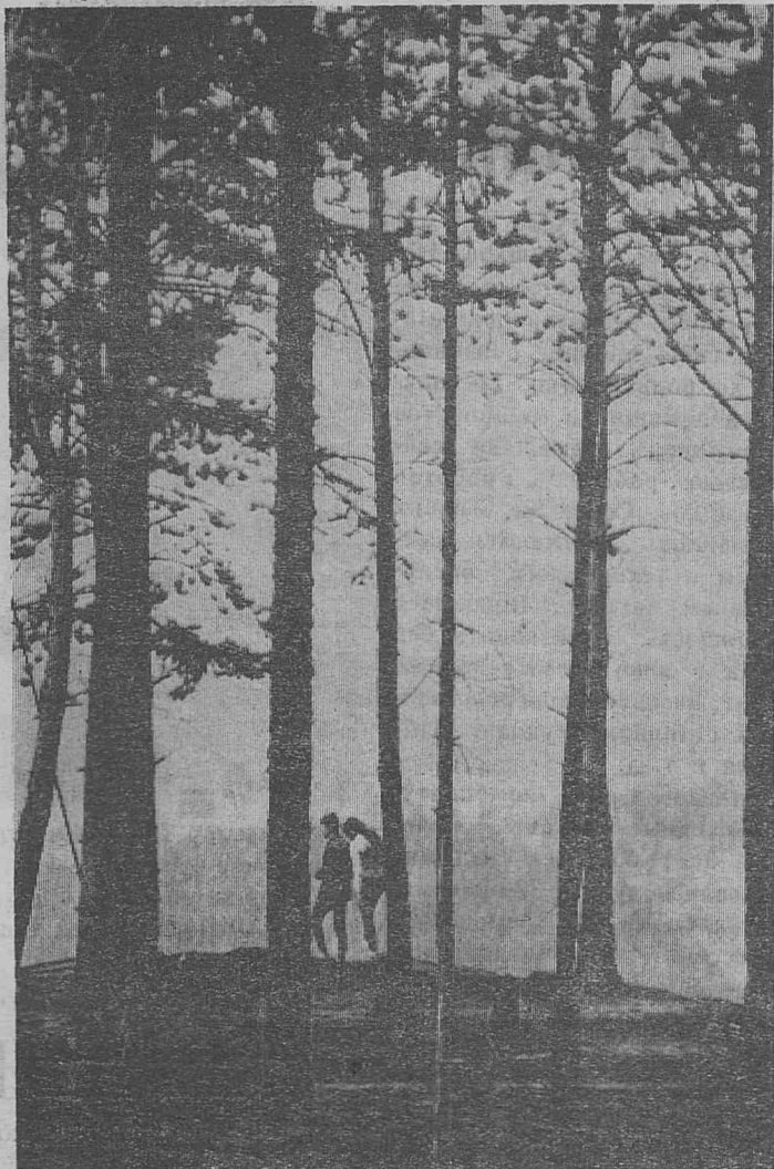
ЛЮБИМЫЙ ГОРОД В СИНЕЙ ДЫМКЕ ТАЕТ...