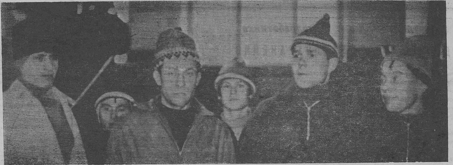
Спортсмены Коршуновского ГОКа, участники лыжного пробега Железногорск—Бодайбо, посвященного 50-летию комсомола и Советских Вооруженных Сил.

Недавно во время охоты, которая происходила близ местечка Вильгайенк (департамент Од, Франция), произошел любопытный случай. Шла охота на зайца, по следу которого бежала собака. Преследуемый заяц вдруг на полном скаку совершил головокружительный поворот на 180 градусов и нос с носом столкнулся с собакой. От сильного удара собака свалилась и сдохла. Однако заяц продолжал бежать, не только потому, что он вышел невредимым из столкновения, но и потому, что растерявшиеся от удивления охотники забыли выстрелить.