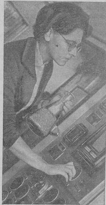
Редактор И. Г. САМОДУРОВ

Для работы на Иркутской ТЭЦ-16 требуются грузчики, слесари котельного цеха. Оплата труда повременная.