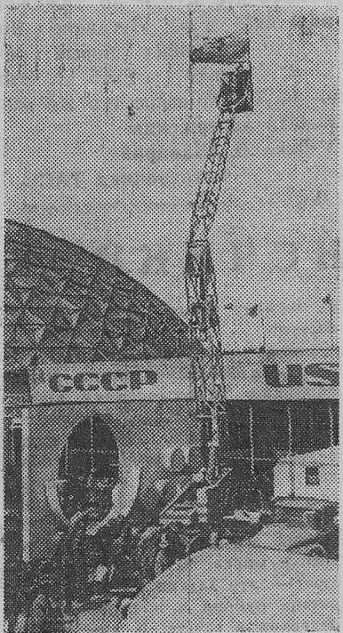
МОСКВА. Международная выставка «Интербытмаш-68».

Демонстрируется советская шарнирная двухсекционная вышка Ш2СВ-18, предназначенная для профилактического осмотра и ремонта фасадов зданий на высоте до 18 метров. Вышка установлена на самоходном прицепе, который может передвигаться по участку со скоростью один километр в час. Механизмы подъема выполнены в виде винтовых домкратов с индивидуальным приводом от электродвигателя. При стационарной стоянке вышки можно осуществлять работы в радиусе до 16 метров. Управление из люльки позволяет обходить выступающие части фасадов зданий, балконы, прохода. Конструкция вышки обеспечивает безопасную работу на высоте. Вышка выпускает Ленинградский литейно-механический завод.