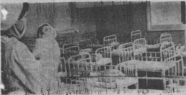
Каждый день увеличивается число жителей нашего города. НА СНИМКЕ: святая святых родильного отделения районной больницы — детская комната.