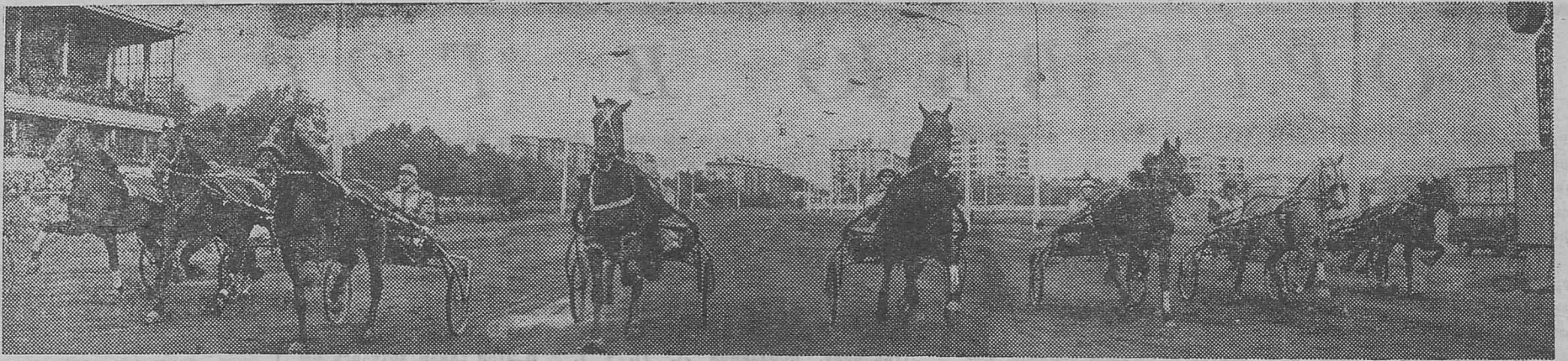
На Московском ипподроме.