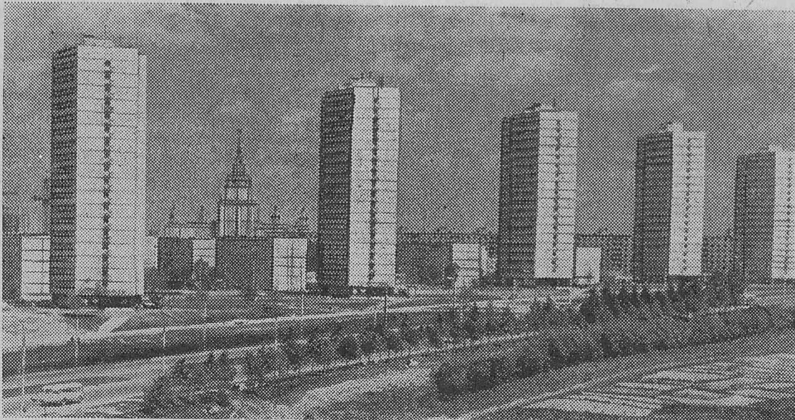
НОВЫЕ 19-ЭТАЖНЫЕ ЖИЛЫЕ ДОМА НА ЛЕНИНСКОМ ПРОСПЕКТЕ.