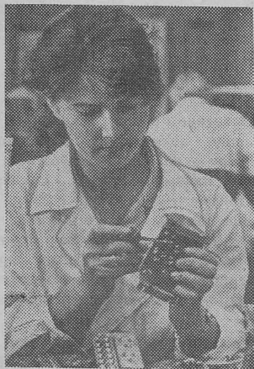
Коллектив молодого предприятия — Псковского завода аппаратуры дальней связи непрерывно наращивает производственные мощности. За четыре года выпуск продукции увеличился бо-

лее чем в 4 раза, а производительность труда за это же время возросла в 2,5 раза.