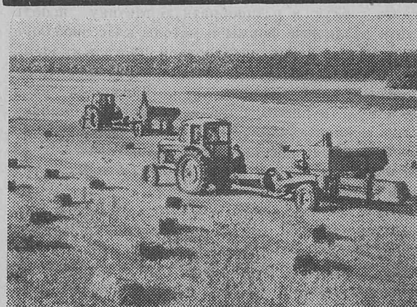
КРАСНОДАРСКИЙ КРАЙ. В совхозе «Березанский» для общественного животноводства будет заготовлено много сена и силоса. В среднем на каждую корову только сена придется свыше 2,5 тонны.

НА СНИМКЕ: прессование сена людерны.