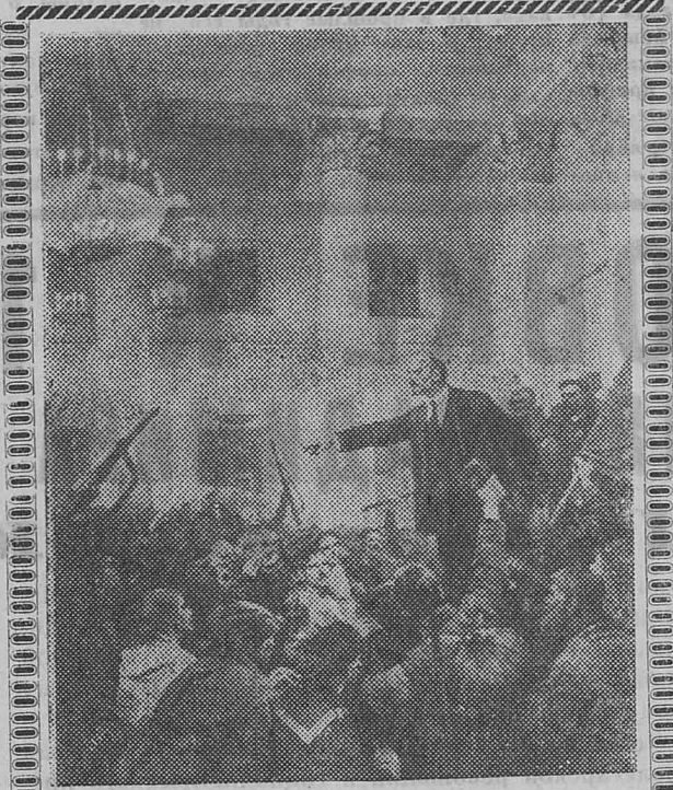
В. И. Ленин провозглашает Советскую власть (с картины художника В. Серова).

Ленин придавал огромное, решающее значение единству взглядов и действий партии, укреплению сознательной дисциплины и сплоченности ее рядов, развитию внутрипартийной демократии, творческой активности членов партии. Он разработал и обосновал нормы и принципы партийной жизни, руководствуясь которыми наша партия добилась выдающихся успехов. В прочных, широких связях с рабочим классом, со всеми трудящимися, в постоянной критической самопроверке — сила и непобедимость нашей партии.