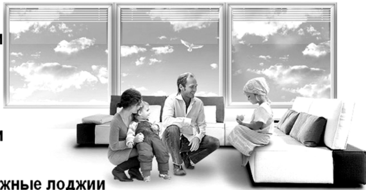
Нам доверяют домашний уют!

Пластиковые окна Алюминиевые лоджии Стальные двери Натяжные потолки Рольставни Межкомнатные двери Жалюзи Пластиковые раздвижные лоджии