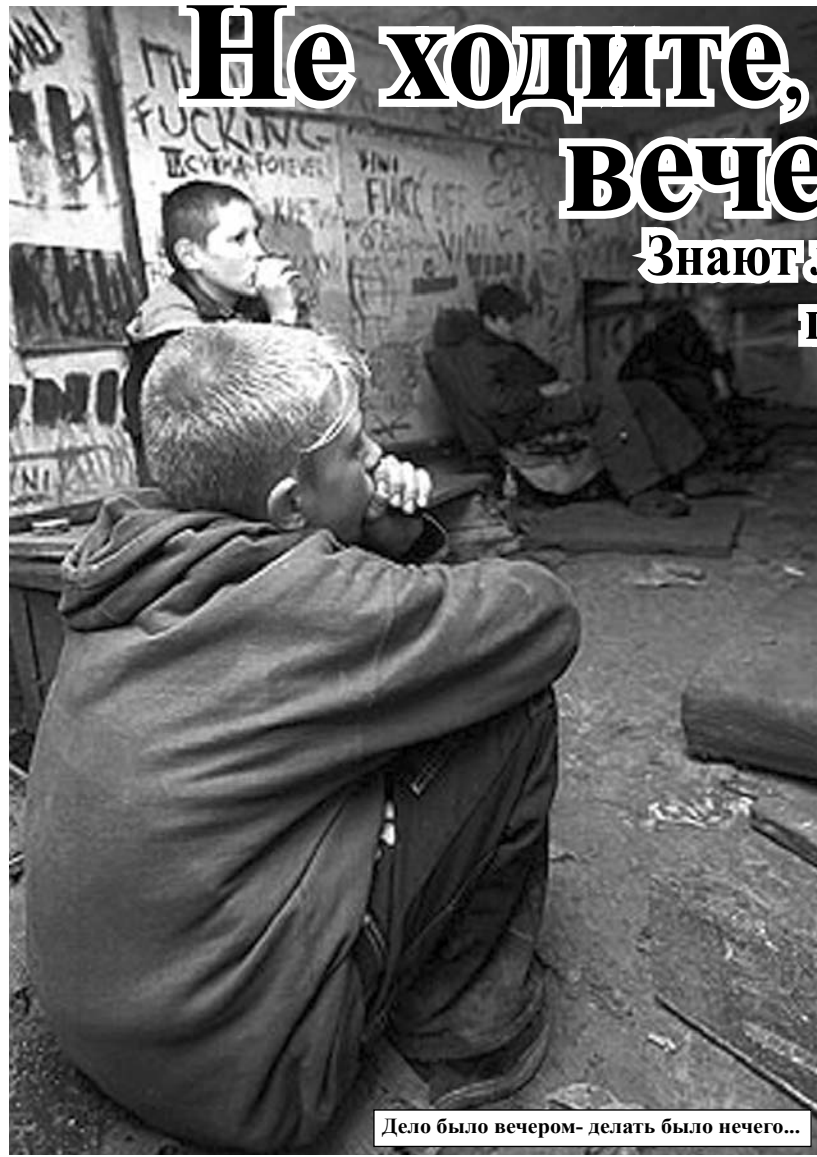
Дело было вечером- делать было нечего...