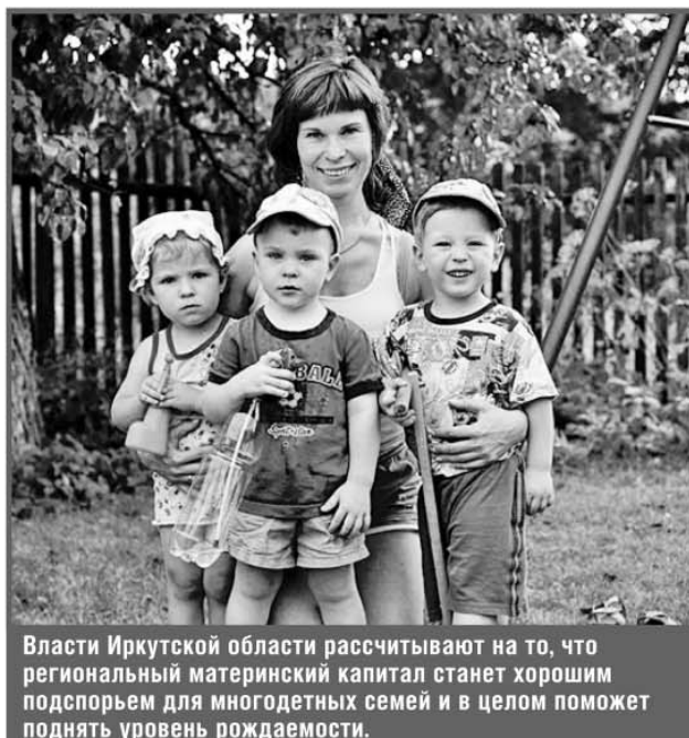
Власти Иркутской области рассчитывают на то, что региональный материнский капитал станет хорошим подспорьем для многодетных семей и в целом поможет поднять уровень рождаемости.